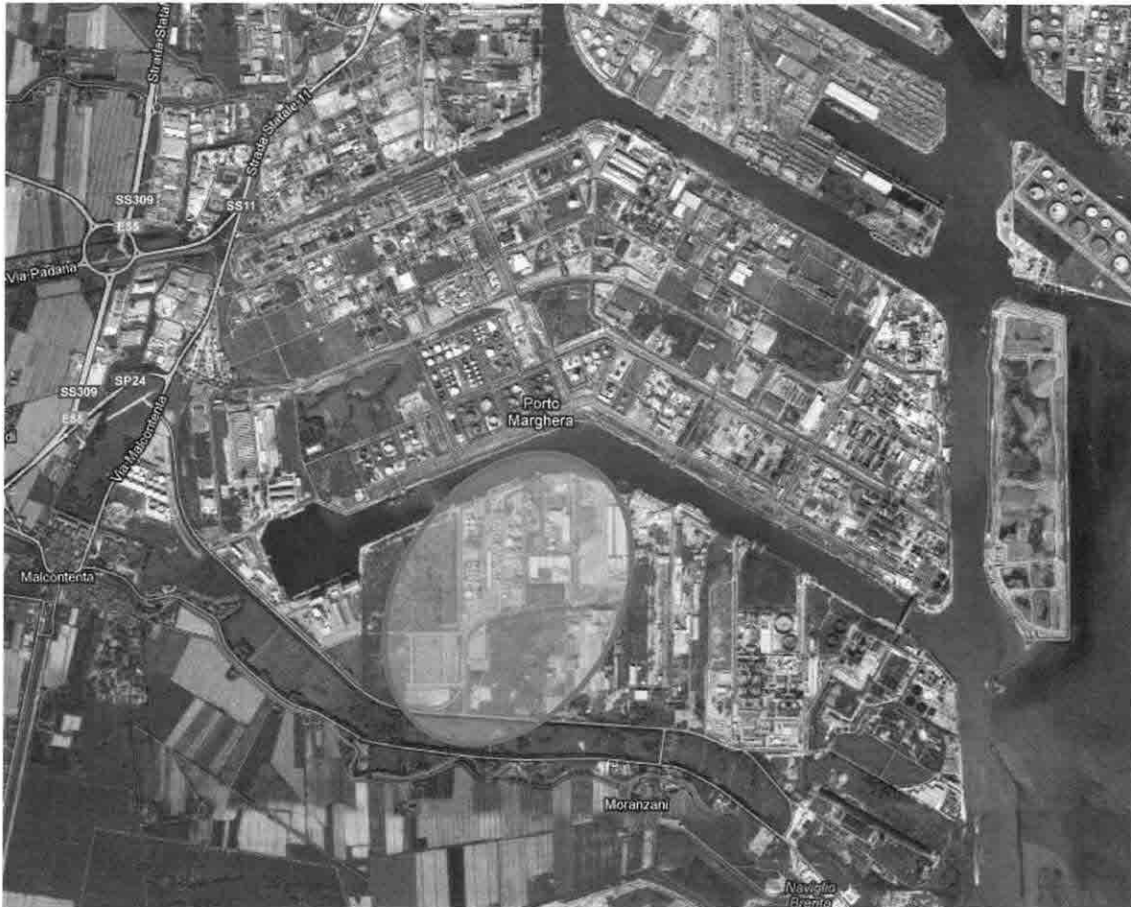
Figura 1- Area Ecodistretto a Porto Marghera - Venezia

Tra gli interventi previsti dall'Accordo, è stato inserito un progetto di riqualificazione del territorio veneziano già compromesso da pregresse attività industriali, con il coinvolgimento del partner Veritas Spa, per la realizzazione dell'Ecodistretto a Porto Marghera.